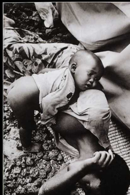
Goma, Zaire 1994: Tras el genocidio, 1.000.000 de personas huyeron a Goma donde hubo brotes de cólera.