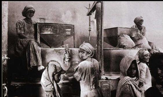
Adua, Etiopía, 1994: La molienda. Los etíopes vivieron en guerra durante 17 años.

Rachelle Thackeray. Fragmento del artículo publicado en The Independent Magazine .