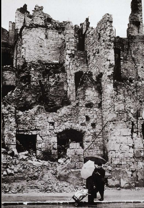
Mostar, Bosnia, 1995: Detenerse un momento para charlar