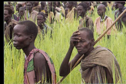
Sudán meridional, 1998.